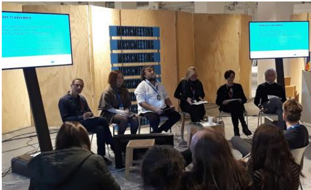
Panel cCLEP!! durante a "Milan Music Week", Novembro 2018