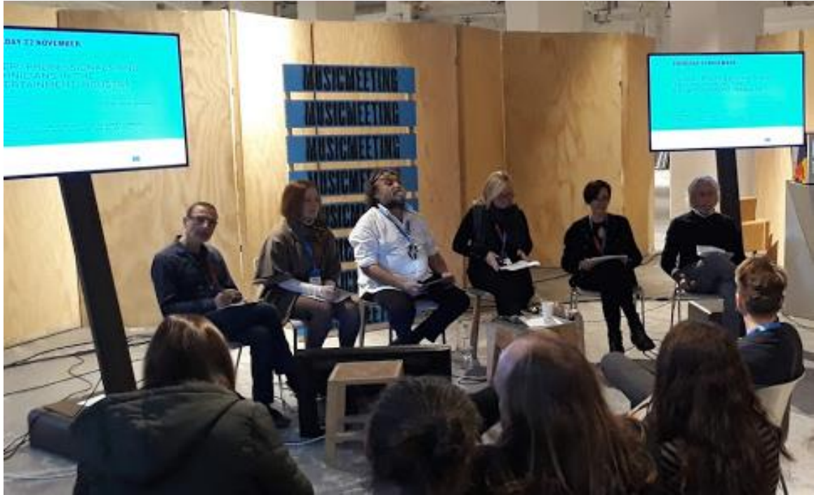
Panel cCLEP! durante la Milano Music Week, Novembre 2018